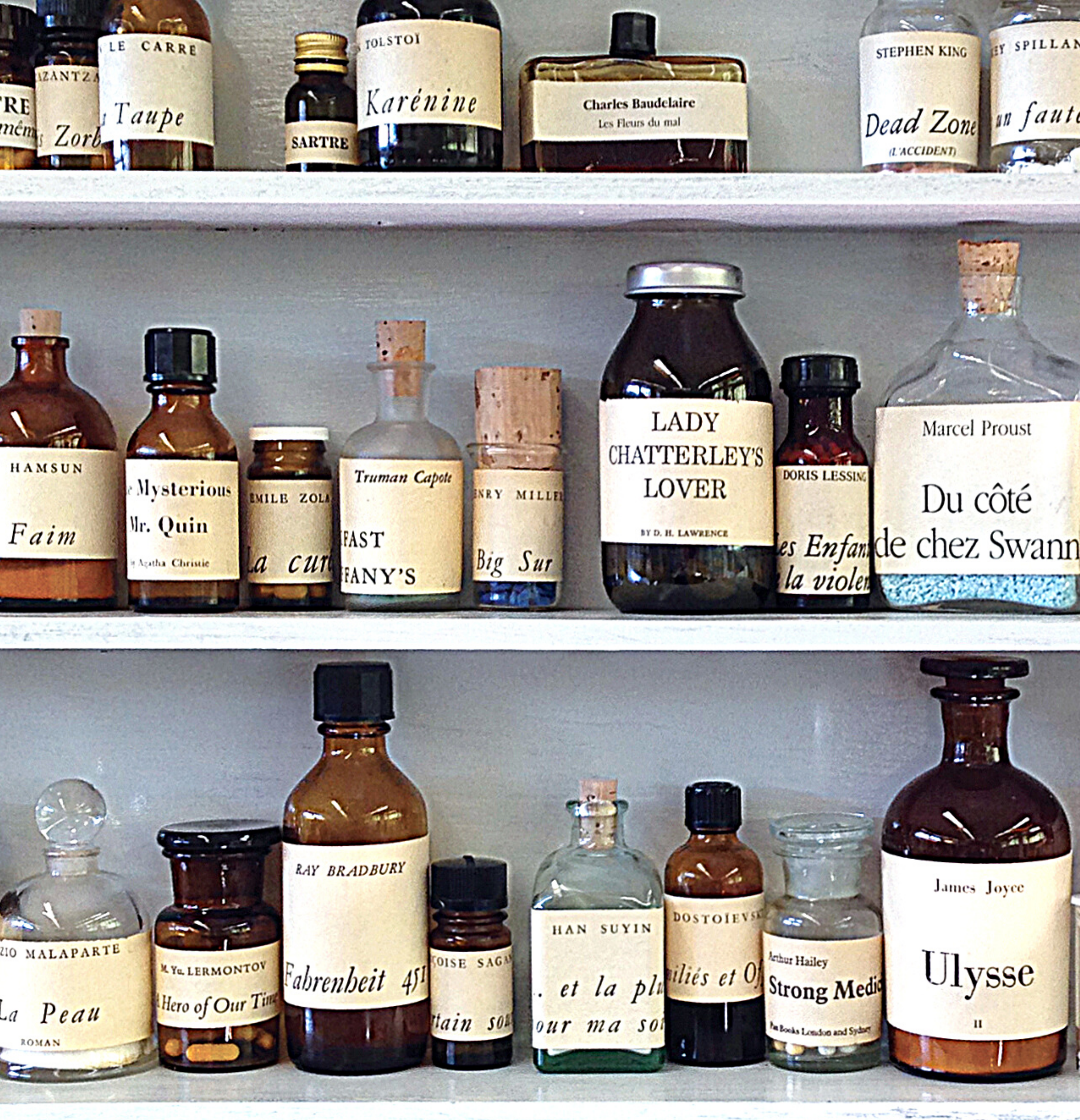
© Illustration : Peter Wüthrich, "Pharmacie littéraire", 2016